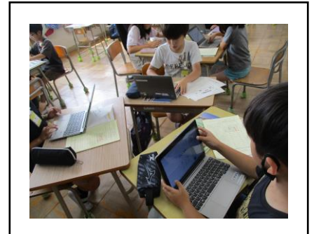
③ 友達と一緒にグループの様子