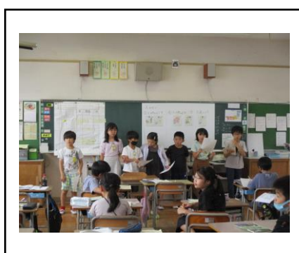
⑤ 班長による今日の発見発表の様子