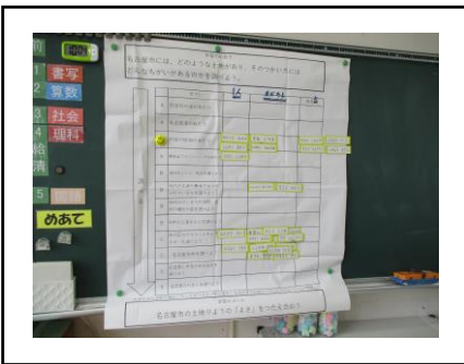
① 各自の課題確認の張り出し