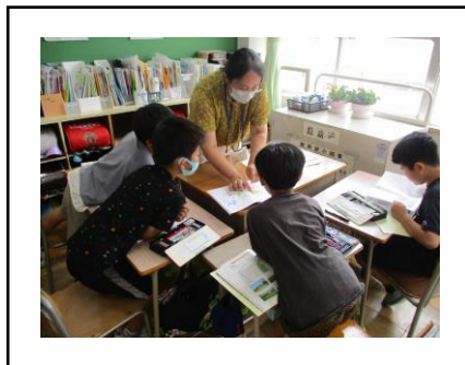
② 教師と一緒にグループの様子