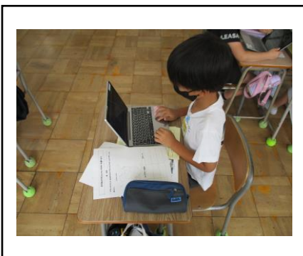
④ 一人で活動する様子