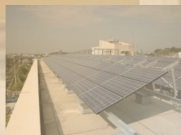
太陽光発電 パネル