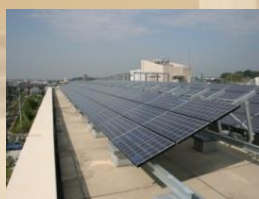
太陽光発電パネル