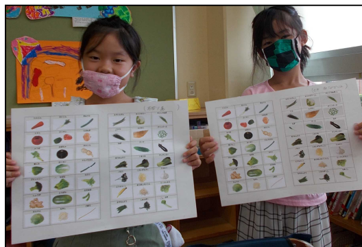
<完成した野菜シート>

振り返りシートには、「似ているけど違う野菜があるのを初めて知った」「知らなかった野菜をシールを貼りながら覚えられて楽しかった」「これからもどんどん学びたい」といった記述があり、野菜についての学習に前向きな態度が育っている様子が見られました。