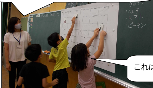
<貼った野菜の答え合わせをする様子>