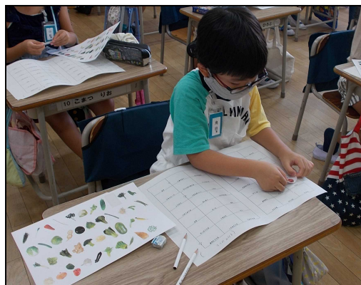
<野菜シールを貼っている様子>