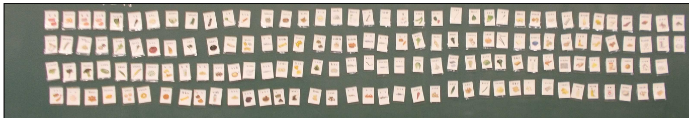
<給食に使われている食品カードを黒板に並べた様子>

給食に使われている食品カードを使って、どんな食品が使われているか知る授業を行いました。