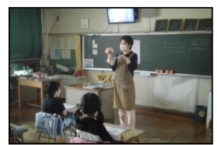
【歯みがき指導の様子】

「歯と口の衛生週間」期間中の6月4日（金）に、3年生で歯みがき指導を行いました。これは、歯肉の病気になり始める割合が高い小学校中学年で、健康な歯ぐきと正しい歯みがきの仕方について学ぶことを目的としています。養護教諭の指導のもと、子どもたちは指導用DVDを見ながらドリルの問題に答えたり、歯ブラシやデンタルフロスを用いた効果的な歯みがきの方法を学んだりしました。これを機に自分の歯みがきの仕方を振り返り、歯を大事にする意識を高めてほしいと思います。