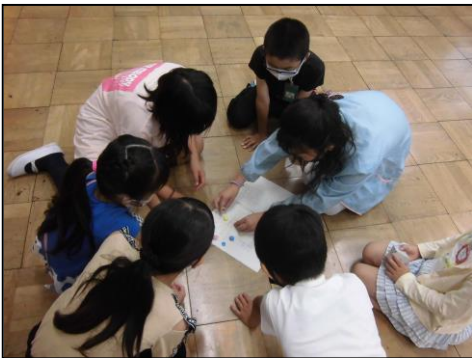
【縦割り集会の様子】

6月4日（金）の朝時間帯に、今年度の縦割り班の顔合わせを行いました。縦割り班とは、一つの班に1年生から6年生がそれぞれ入り、異学年との関わりを深め、児童相互の望ましい人間関係を育成していきます。一人一人の新たな良さを発見できるように活動を工夫します。グランドデザインにも「縦割り集会の充実」と明記したように、今年度も重点を置いて取り組んでいきます。