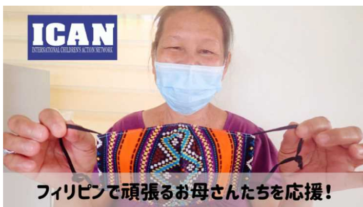
フィリピンで頑張るお母さんたちを応援!

https://readyfor.jp/projects/ican-ngo/announcements/147264