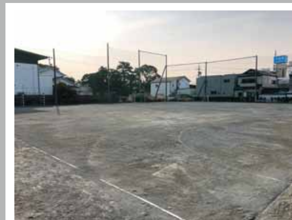
水はけ抜群の『グリーンサンドコート2面』