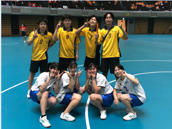
体育祭2021部対抗リレー@日本ガイシホール