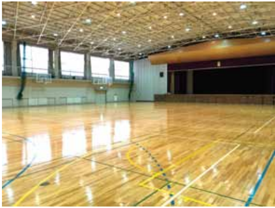
公式戦が開催される『新体育館』