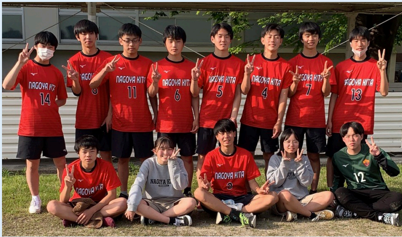
たった1人で引っ張った3年生の引退