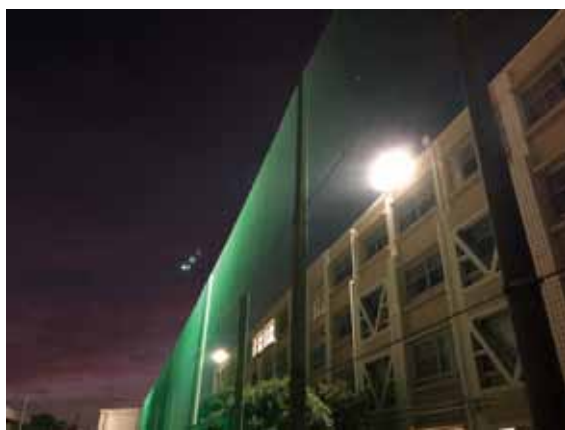
日の入後は夜間照明設備