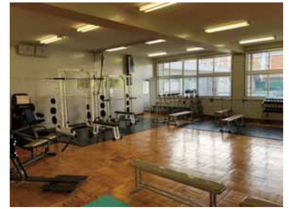
充実の器具が揃う『トレーニングルーム』