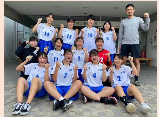
県大会会場で記念写真