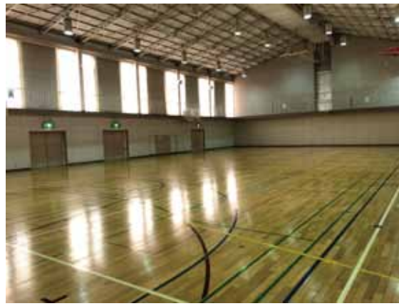
公立高校では珍しい『第2体育館』