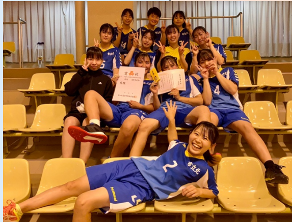
県大会決定記念写真