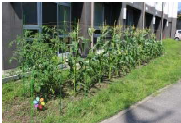
特別支援学級の皆さんが育てている夏野菜 すくすく元気に育っています!