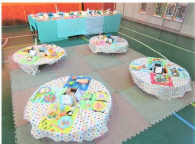
【1年 ごちそうパーティーをはじめよう!】