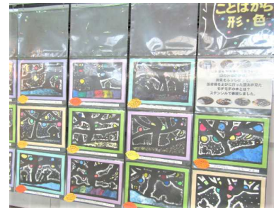
【3年 ことばから形・色】