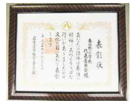
【授与された表彰状】

INGスローガンを全校児童に伝えたり、ソーシャルディスタンスを保ちながら遊べるゲームを考えたりする活動が認められ、本年度も名古屋市教育委員会から表彰を受けました。