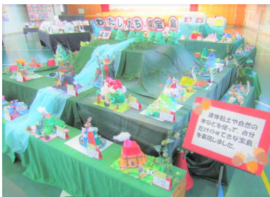
【4年 わたしたちの宝島】