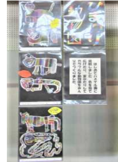
【ひまわり ひまわり動物園】