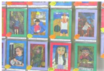
【5年 輝いている今この瞬間 ～ This is me～】