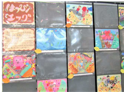
【2年 はっぴーエッグ】