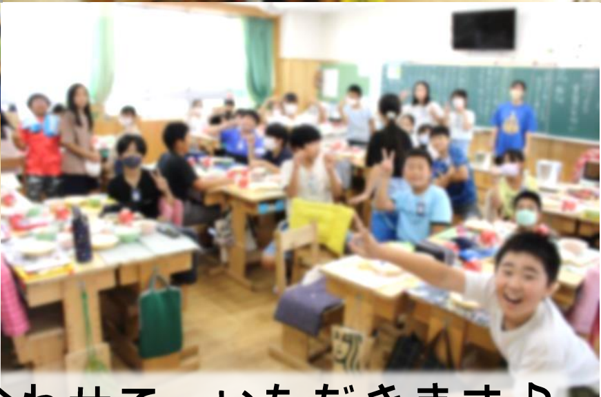
手を合わせて、いただきます♪