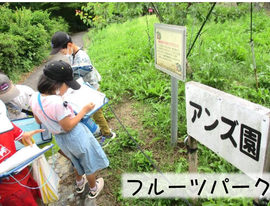
フルーツパークに行ったよ♪