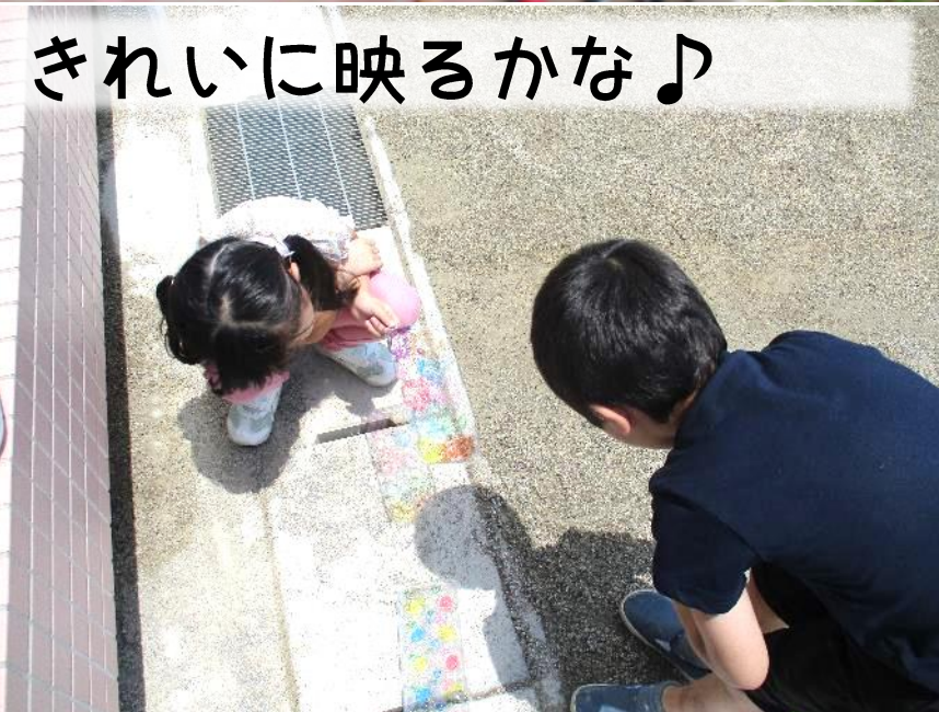
きれいに映るかな♪