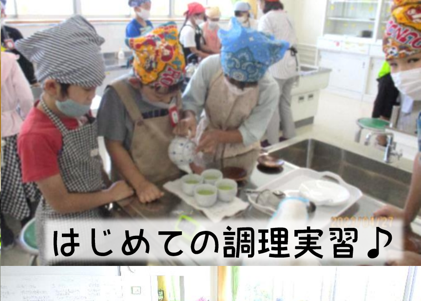
はじめての調理実習♪