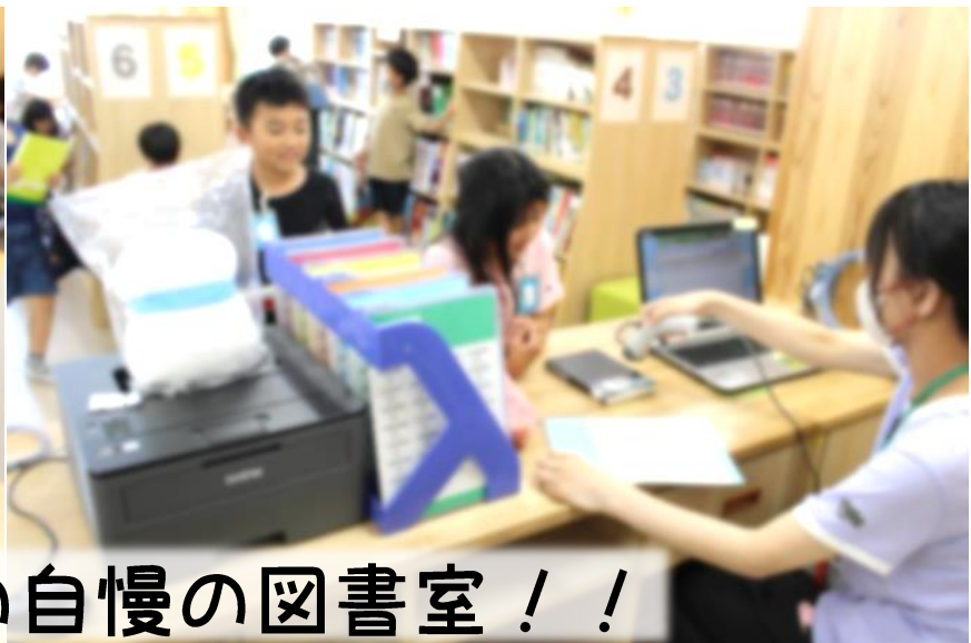
私たちの自慢の図書室！！