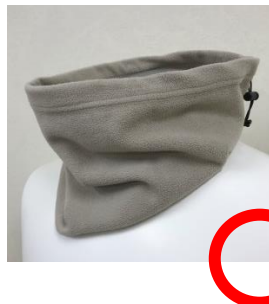
色は自由だが、華美でない色・柄が望ましい