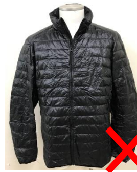
ダウンジャケットは不可