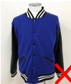
スタジアムジャンパーは不可