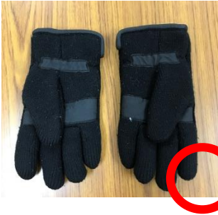
5本指のものが望ましい