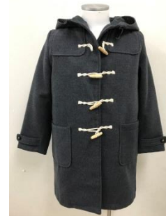
ダッフルコートフード付きは不可 フードなしは可