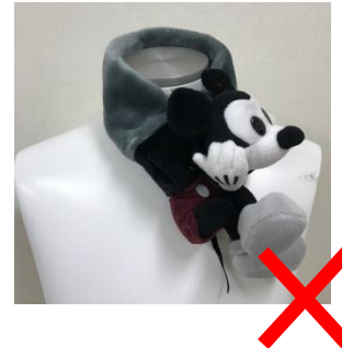
飾りの付いたマフラーは不可