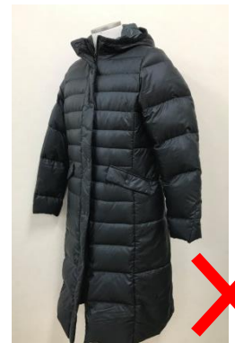
ベンチコートは不可