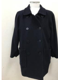
トッパーコートは可