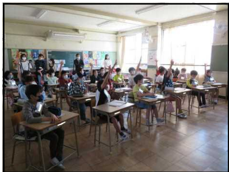
【4年生 外国語の様子】