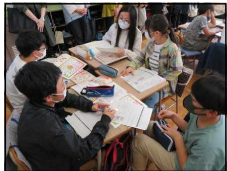
【6年生 家庭科の様子】