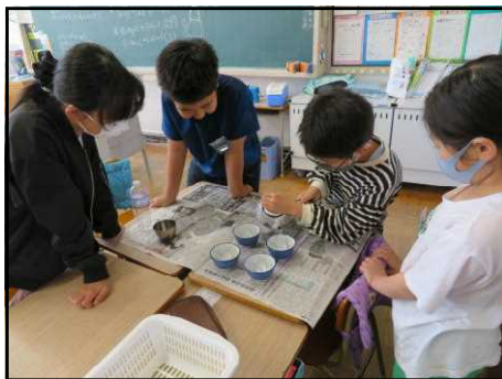
【5年生 家庭科の様子】