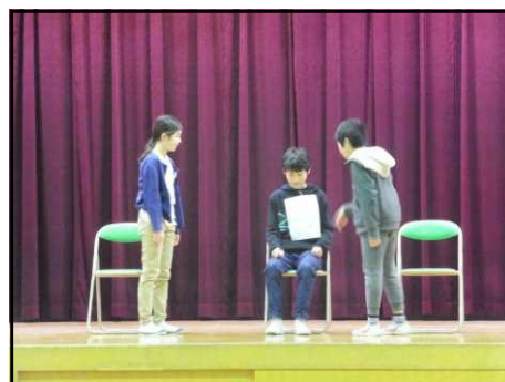
【認め合い・助け合いの創作劇の様子】