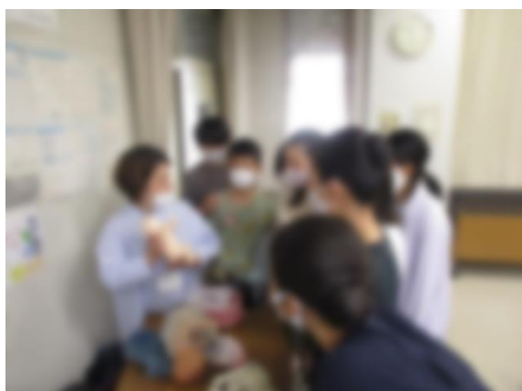
【助産師さんに質問をしているところ】