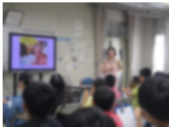
【赤ちゃんの産声を聞いているところ】