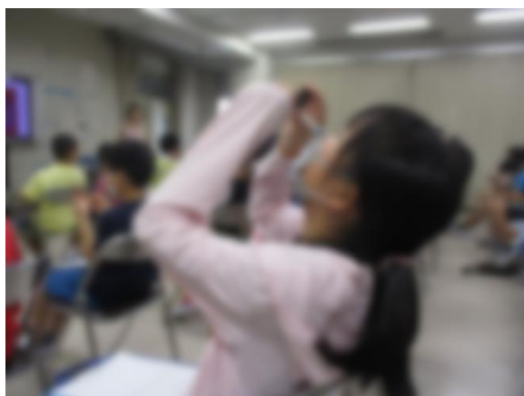
【卵子の大きさを実際に確認しているところ】