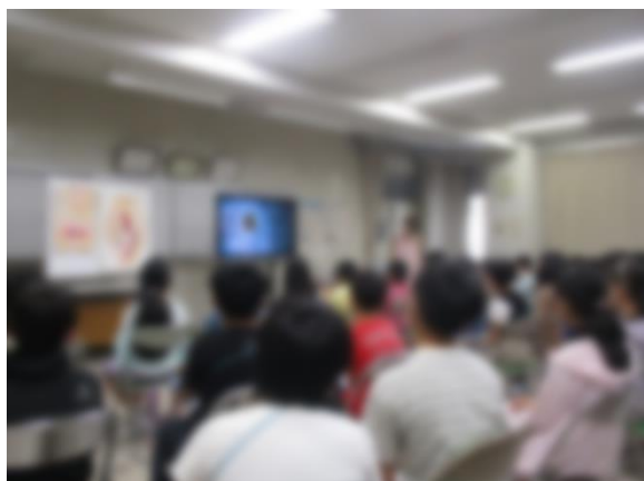
【命の始まりについての映像を見ているところ】

7月12日（水）に助産師の方を講師にお迎えして、「思春期セミナー」を行いました。自分の命の始まりから誕生までを振り返ったり、家族や周囲の大人に大切に育てられて成長してきたことを再確認したりしたことで、自分は「かけがえのない存在」であることを実感できる貴重な時間となりました。また、6年生のこの時期は、思春期の初期に位置していることを認識し、思春期の体と心の変化、発達個人差などについてもしっかりと学ぶことができました。