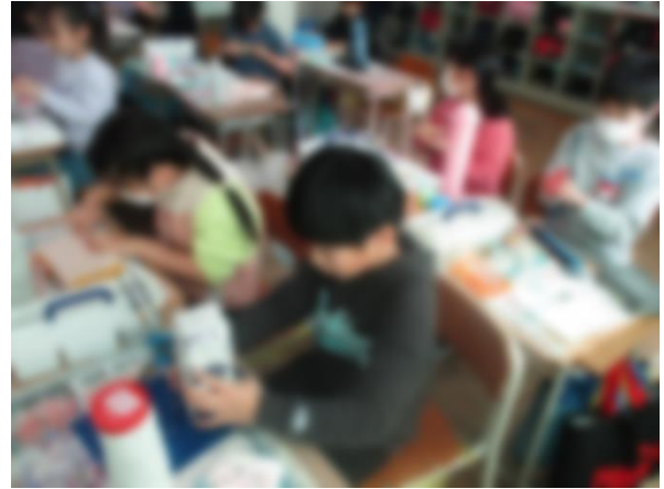
【未来の名古屋のまちをつくっている様子】

名古屋市やわたしたちの生活の移り変わりについて学んだ子どもたちは、学習のまとめとして「未来の名古屋のまち」を粘土や空き容器などを使ってジオラマに表しました。子どもたちは、未来の名古屋市や自分たちの生活がどのように変わるのか、想像を膨らませながら楽しく製作していました。