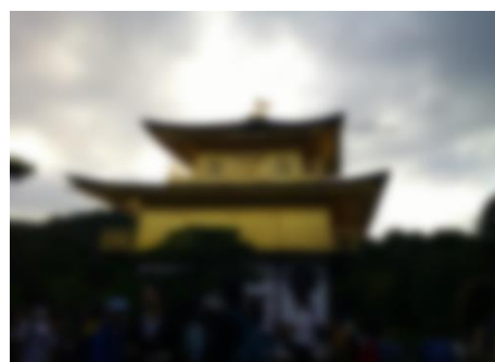
【まぶしいくらい輝いていた金閣寺】