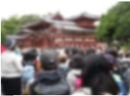
【美しさに驚いた平等院鳳凰堂】

見学場所では、バスガイドさん、学生ガイドさん、シニアガイドさんの説明を熱心に聞き、メモを取る様子に感心しました。お買い物では、家族に喜んでもらえる物を真剣に選ぶ様子や、友達と記念に残る物を楽しそうに買う様子が見られました。歴史を学ぶだけでなく、友達とのかけがえのない時間を共有することで、思い出に残る修学旅行となったと思います。