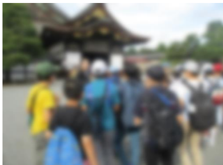
【初めて聞く「鶯張り」の音に感動した二条城】