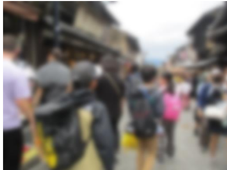
【おみやげ探しが楽しかった清水坂】