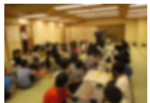
【自分で色を作って絵を描いた漆器加飾体験】