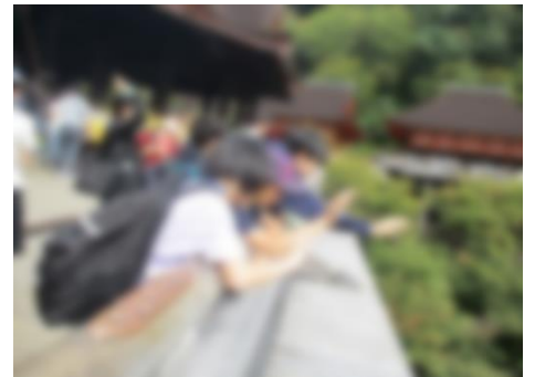
【舞台からの眺めが最高だった清水寺】