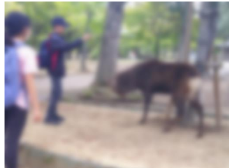
【鹿とたくさん触れ合った奈良公園】