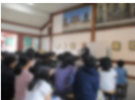
【お坊さんのありがたいお話を聞いた薬師寺】