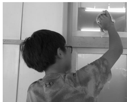
【栽培・美化委員会】