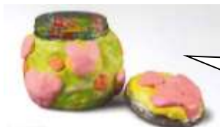
ビンを用いた作品

お子様と一緒に、 身近にある空き容器 （ペットボトル、ビン、カップ、トレーなど）を集めていただくと助かります。持ってくる日については担任から後日お知らせします。お手数ですがよろしくお願いします。