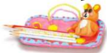
トレーを用いた作品