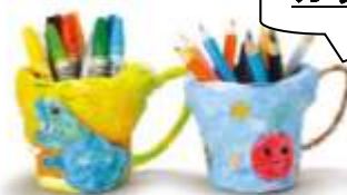
カップを用いた作品