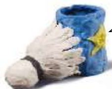
ペットボトルを用いた作品