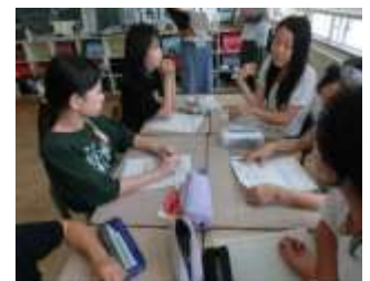
【話し合い活動の様子】

授業では、作成したシートを基に、他の係と話し合い、互いに質問したり、助言や感想を伝えたりしていました。話し合い活動では、自分の考えをしっかりと話す姿、相手の話をしっかりと聞き、助言や感