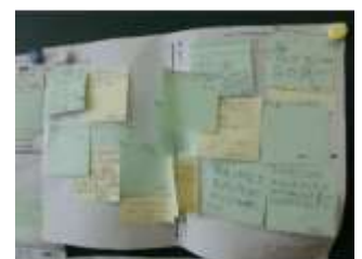
【付箋を利用したシート】