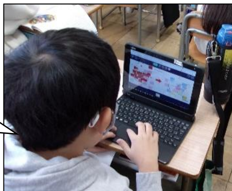
<自分の考えをタブレットで共有する様子>