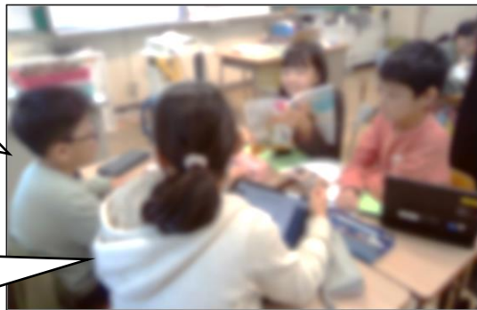
【グループで意見交流をする様子】

ごんは、くりや松たけを置いていたことを、兵十に気付いてもらえて、うれしかったと思うよ。