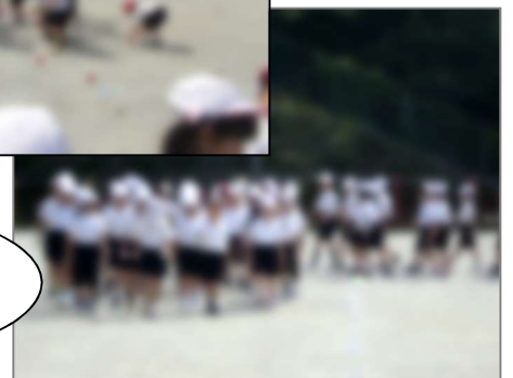
【玉入れの練習をする様子】