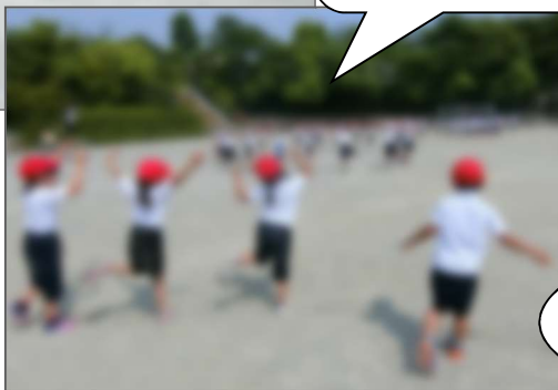
【ダンスの練習をする様子】