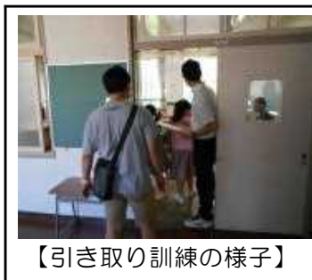
【引き取り訓練の様子】

子どもが持ち帰った「防災ノート」をご家庭でも見ていただき、ご家族で災害に対する対応の仕方について、もう一度ご確認していただくと良いと思います。「防災ノート」は、今後、学校で活用しますので、ご覧になりましたら、学校へ持たせてください。