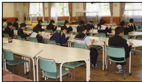
＜ランチルームでの昼食＞