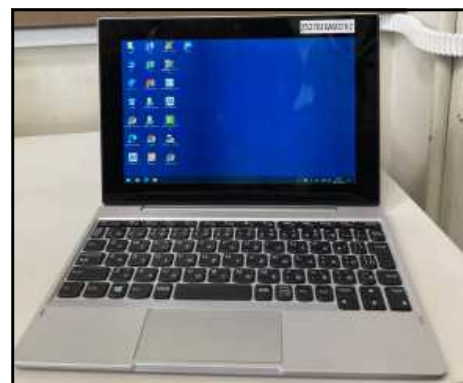
＜生徒用タブレット(キーボード付き)＞

※ 生徒のSNSの使い方に関するトラブルがまだまだ減りません。学校でも随時指導をしておりますが、これを機会に、ご家庭でもタブレット・スマートフォンの利用について、マナーや約束ごとなどを話題にさせていただきますようお願いいたします。