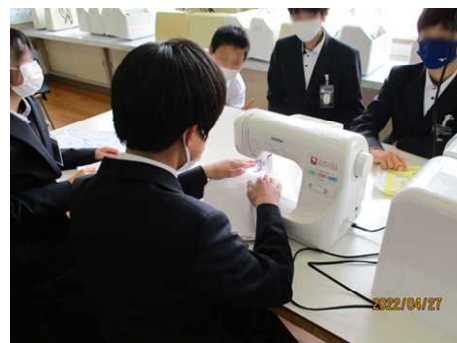
雑巾づくりの様子

学年目標「磨く」の達成に向けて、少しずつ準備を始めています。総合的な学習の時間や学活に、ミシンを使って、雑巾づくりをしました。これを使って、どんどん環境をピカピカに磨いていきましょう。また、この1年の「磨く」目標を、自分、周り、学年に分け、書きました。みなさんが書いた目標の一部を紹介します。