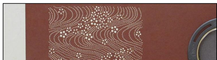
伊勢型紙の手彫りによる細工