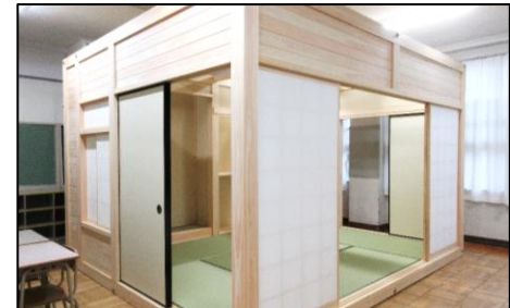
教室の一角にできた和室

ふすまの取っ手には、伊勢型紙（いせかたがみ）が使われています。型紙に開けられた細かい模様は、全て彫刻刀で彫ってつくられたものです。