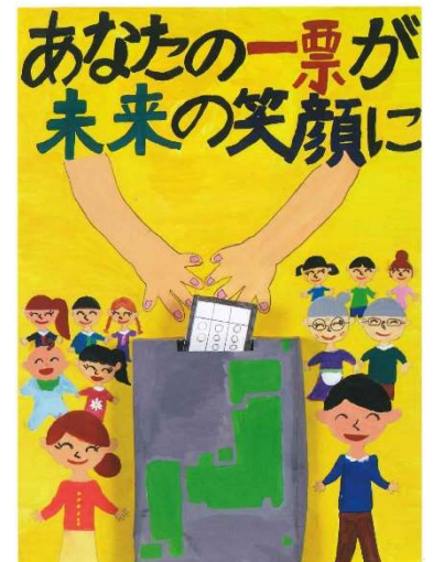
令和2年度明るい選挙ポスターコンクール 文部科学大臣・総務大臣賞受賞作品 (小学4年生)