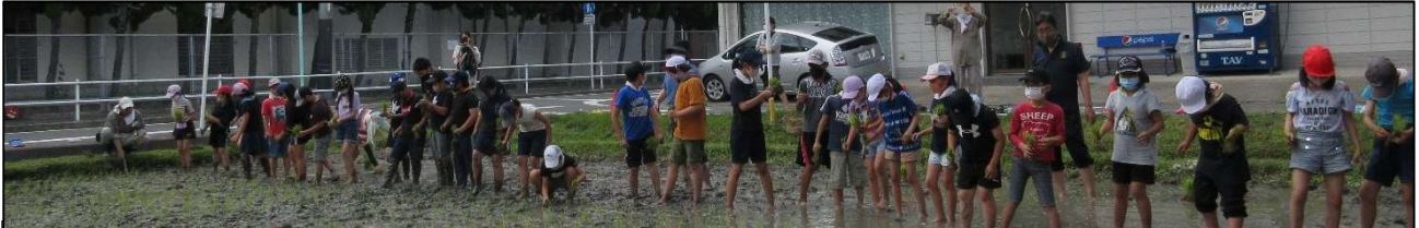
学区の方に教えていただき、みんなで一列に並んで田植えを行いました。

今後、10月の稲刈りまで大切に育てていきます。当日来ていただいたり、お手伝いをしたりしてくださった保護者や地域の方々、ありがとうございました。