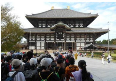
【大仏殿は大きいな！】

10月11日（月）～12日（火）に、6年生が奈良と京都へ修学旅行に行きました。古都を巡りながら、法隆寺や奈良の大仏、金閣等、社会科で学習した寺院を直接見学することで、日本の歴史に思いを馳せることができました。