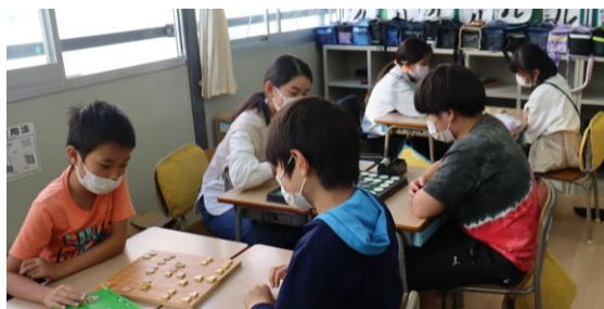
【将棋やオセロを楽しんだよ！】