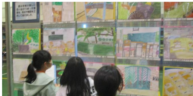
【どの作品もすごく上手だね！】