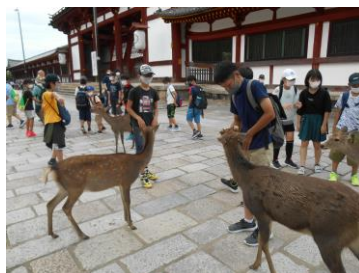
【鹿がたくさんいたよ！】