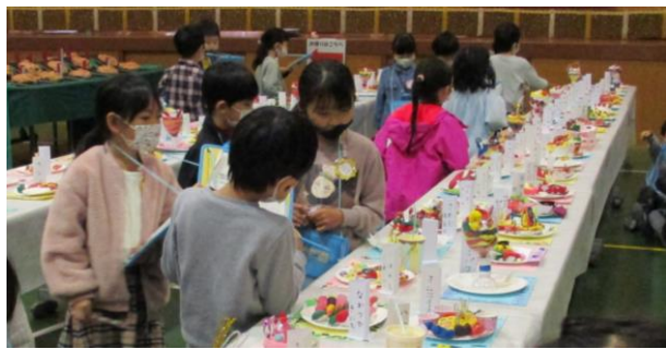
【カラフルでおいしそうなお作品だね！】

11月5日（金）～6日（土）に、作品展がありました。併せて6日（土）に授業参観がありました。どの作品も力作ばかりで、子どもの自由な発想と頑張りがよく伝わってきました。児童鑑賞では、たくさんの作品を鑑賞することができ、とても良い経験になりました。