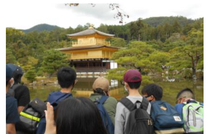
【金閣は本当に金色だ！】