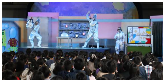
【役者さんの演技がすごかったよ！】

10月18日（月）に2・4・6年、20日（水）に1・3・5年とひまわり学級が、劇団うりんこによる「小学校は宇宙ステーション」を鑑賞しました。役者さんの演技に引き込まれながら、笑いあり涙ありの劇を間近で観ることができました。