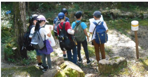
【仲間と協力して問題を解いたよ！】

10月5日（火）に、5年生が中津川野外学習に行きました。天候に恵まれ、子どもたちは自然の中で、スコアオリエンテーリングやキャンプファイヤー、栗拾い等、学校では味わえない多くの体験をすることができました。