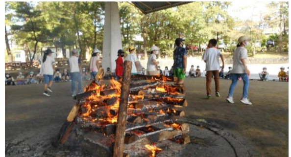
【クラスごとにスタンプをしたよ！】