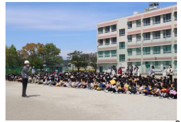
校長先生のお話を聞く様子

緊急地震速報が鳴ったら素早く机の下に隠れ、先生の指示に従って校庭に避難する訓練を行いました。新1年生も、先生の話をよく聞いて、素早く避難することができていました。定期的に行われる訓練に真剣に取り組み、いざという時に自分の身を守ることができるようにしてほしいと思います。ご家庭でも、万が一の災害に備え、家族の集合場所を決める等、話し合いを進めてください。