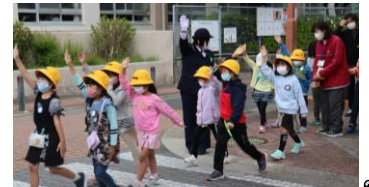
手を挙げて安全に横断！

子どもたちが交通ルールを守って安全に過ごしているかどうか、ご家庭でも日頃から話題にしてくださいようお願い申し上げます。