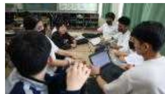
実行委員会の話し合い

春日井市少年自然の家で「カレー作り」や「レクリエーション」を計画し、『いろいろ学年』が、様々な工夫を凝らして準備を進めています。『笑顔』で楽しい思い出を創りましょう！