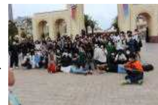
USJ前で全員写真撮影

初日は小雨に見舞われましたが、3日間予定していた活動を全て実施することができました。1日目に「ユニバーサルスタジオ」、2日目には、「大阪市内分散活動」、3日目には、滋賀県高島市で「自然体験活動」に取り組みました。終始、『笑顔』があふれる『こもれび学年』らしい温かい雰囲気の旅となりました。