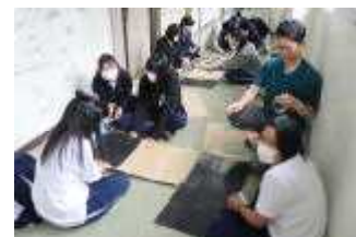
実行委員会の制作場面

稲武野外学習に向けて、順調に準備を進めています。6月6日には説明会を開きました。既に実行委員会が立ち上がり、『つながり学年』が、稲武を通して一つになり、『笑顔』で盛り上げられるようにするために企画を進行中です。当日がとても楽しみです。