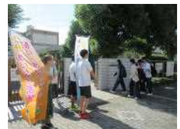
正門でPTAと生徒会がコラボレーションする様子

6月12日(月)～16日(金)の5日間に渡り、PTA役員・委員の方々が「ふれ合いあいさつ運動」を実施しました。梅雨の季節で雨天や曇天の日も多かったですが、毎朝、欠かすことなく活動していただきました。13日(火)には、生徒会執行部も「グッドモーニングキャンペーン」として、一緒に活動しました。