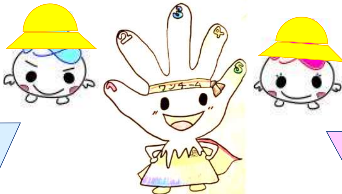
6年生のマスコットキャラクター