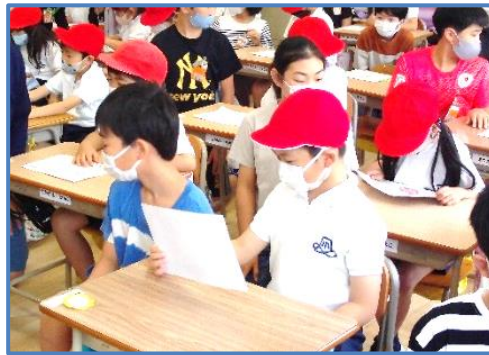
【もらった動物の絵を熱心にみる1年生の様子】