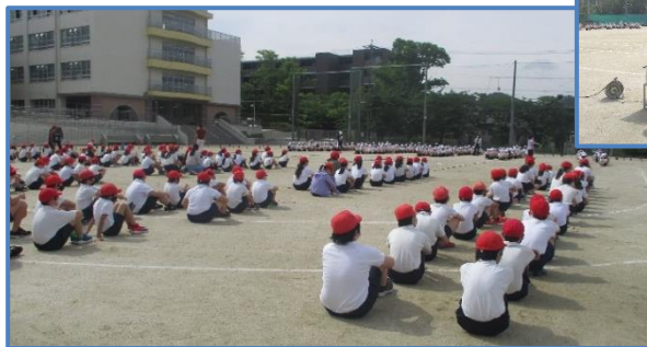
【5・6年合同の綱引きの練習】