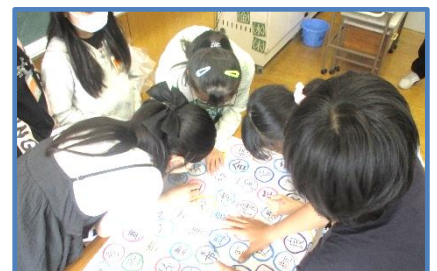
【学年旗を作成する様子】

学年目標が決まってからキャラクターを募集し、全員の投票でキャラクターを決めました。旗にはそのキャラクターを中心に、子どもたちの名前から一文字漢字を選んで、一人一人名前を書きました。運動会でも登場します。