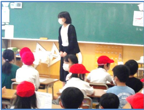
【あいさつをする代表児童】

さらに、パートⅡでは、運動会応援カードを作成し、1年生にプレゼントをしようと準備を進めています。