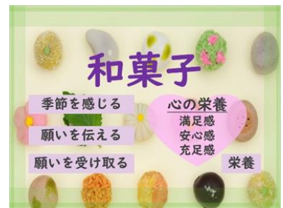
「わたしが親しみを感ずる『食』」