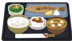
「食べる順番について考えてみよう」