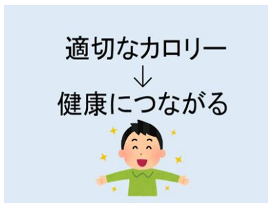
「カロリーについて知ろう」