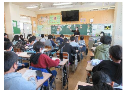
「朝食の大切さ知ろう。」