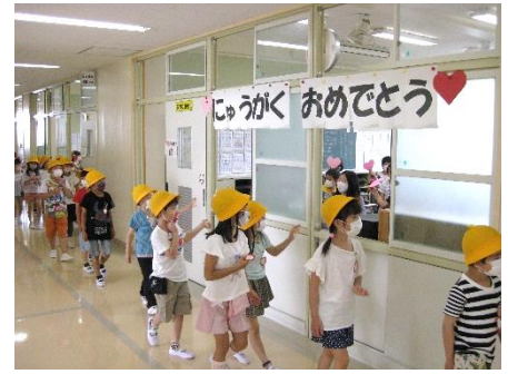
少し緊張しながら、手を振って応える姿も見られました。心の距離は近づいたでしょうか。