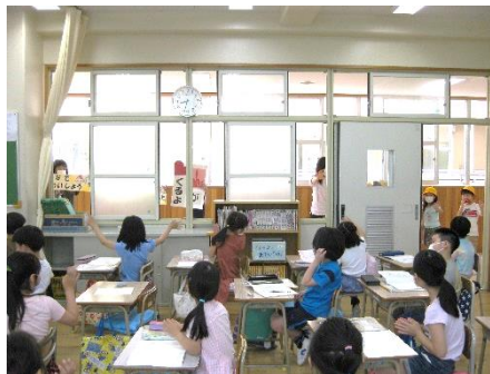
各教室では、大きな声を出さず、手を振ったり、曲に合わせて手拍子したりして歓迎しました。