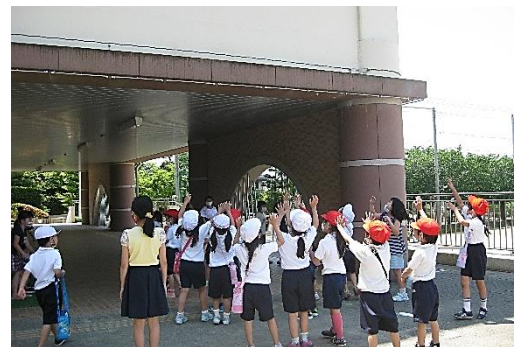
<熱中症対策としてミスト設置>

なお、8月11日～14日は、学校閉庁日となっております。緊急のご連絡がある場合は、教育委員会 指導室（972-3232）へお願いします。