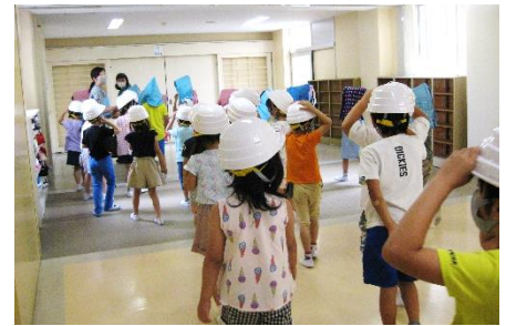
<1年生の避難の様子>

6月16日、今年度最初の避難訓練を行いました。地震発生後、給食調理場から出火したことを想定しています。1年生は今年度から配布が始まった防災ヘルメット、2年生以上は防災頭巾を使用して、静かに落ち着いて避難することができました。新型コロナウイルス感染症対策と同時に、自然災害にも対応できる力を身に付けていきます。