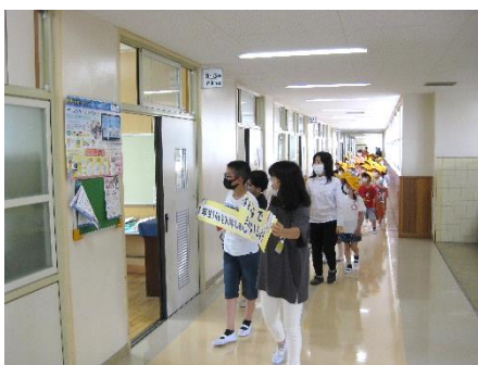
6年生の代表を先頭に全クラスの廊下を歩いて回ります。

富士見台小学校の「新1年生を迎える会」は、通常体育館で行います。上級生が準備した花のアーチをくぐって入場し、互いに声を掛け合ったり、校歌を歌ったりします。今年度は、会を中止するのではなく、感染症に配慮した会にしました。