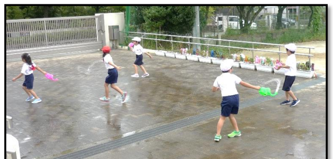
生活科「なつは たのしいことが いっぱい」

両方の山が、負けずにどっと火を噴き出した様子を、体で表現しました。勢いよく火が噴き出すことを読み取ることができました。