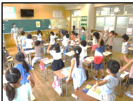
国語科「けんかした山」

両方の山が、負けずにどっと火を噴き出した様子を、体で表現しました。勢いよく火が噴き出すことを読み取ることができました。