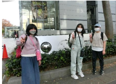
校外学習「名古屋市科学館」