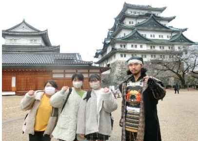
校外学習「名古屋城」