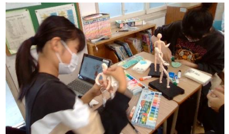
作品展「未来のわたし」