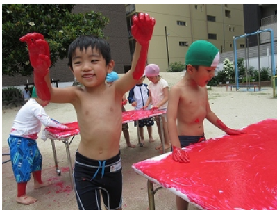
「ワーツ」 「きょうりゅうになっちゃった」

コロナ禍でプールに入ることにはできませんが、フィンガーペインティング、樋や水車などを使って水遊びを楽しんでいます。