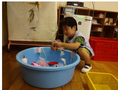
つくった魚でさかなつり