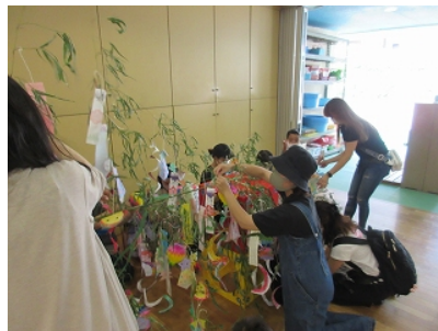
願い事かなうといいね