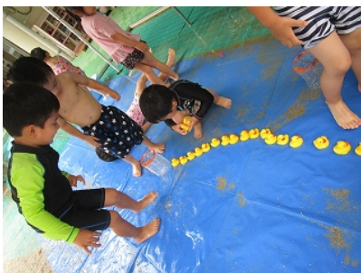
「アヒルさんがならんだ」