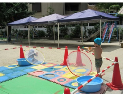
ガードがあるから当たっても大丈夫！