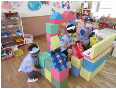
僕たち警察 パトロール中