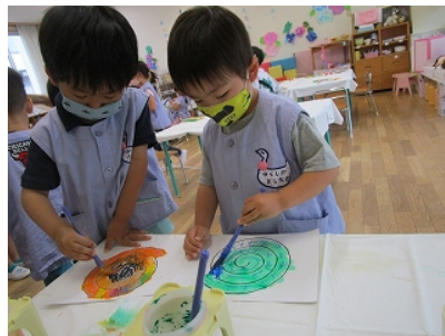
うずまき 「はみ出さないように気をつけて塗ろう」