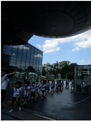
プラネタリウム楽しみ