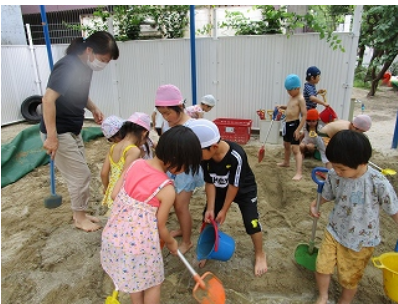
大きな川もできたよ