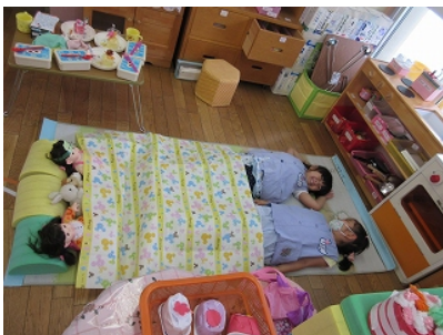
夜になったよ 「みんなで一緒におやすみなさ〜い」