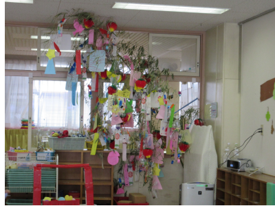
保育室に立ててもらいました 願い事がかないますように