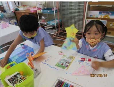
星人形 「かわいくできた」