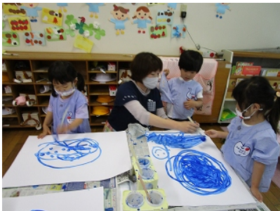
大きな紙に絵の具でお絵かき 「ぐるぐる、てんてん」 「お池になっちゃった、お山もできたね」