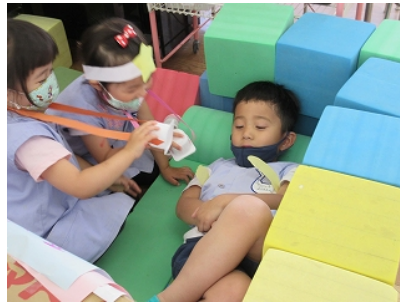
お医者さん 「どうしましたか?」「おなかが痛いです」