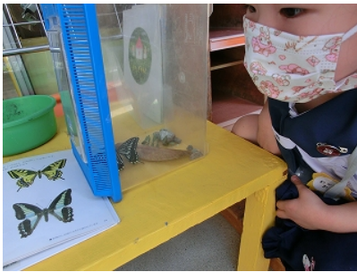
アゲハチョウが生まれたよ