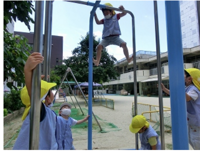
「ここまで登れたよ」「すごいね」