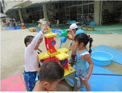
「流すよー」 「まわるまわる」