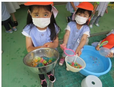
「こんなにすくえたいよ」