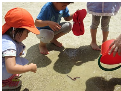
「大きいミズ見つけた」