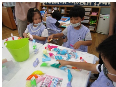
きれいな飾りができてうれしいね