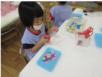
「チョキン、チョキン」いい音がして楽しいね 切った紙はビニル袋に入れて魚にしました