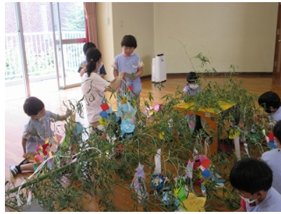
願い事がかないますように