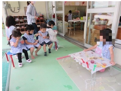
色水のジュース屋さん 「おいしいね」