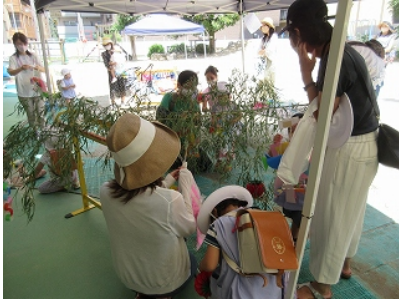
七夕飾り 先生と作ったさかなや好きな絵短冊を保護者に 結んでもらいました