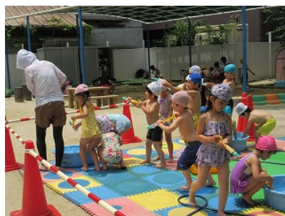
狙って狙って思い切りとばそう！