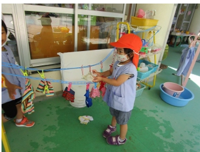
ぼぼちゃんの服をお洗濯