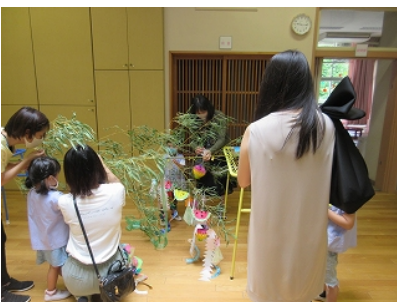
できた飾りはそれぞれの願い事と一緒に保護者の方と笹に結びました