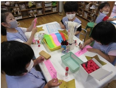
まずは短冊に自分の名前を書いてこよりを付けます