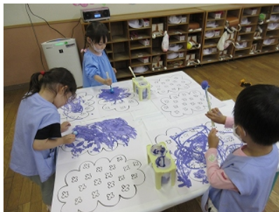
「今日の色はあじさい」