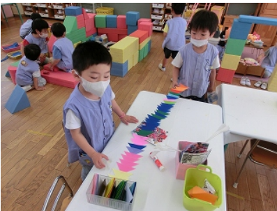
三角つなぎ いっぱいつなげよう