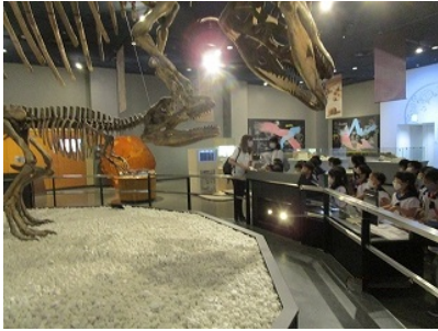
プラネタリウムの後、科学館の施設を見学したり、体験したりしてきました