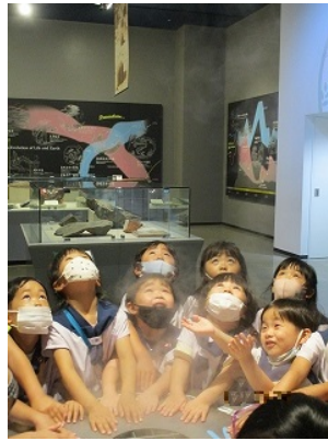
雲のリングが飛び出してきたよ