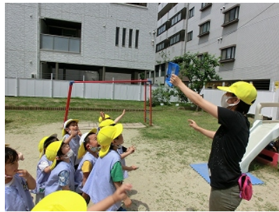
「ちょうちょさん、ばいばーい」