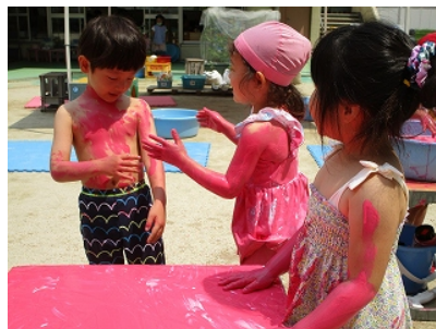
「べたべた ○○くんにもつけちゃおう」