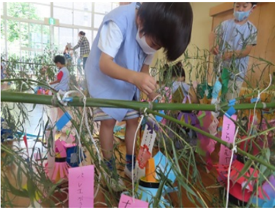
落ちないようにしっかりと2回結びます