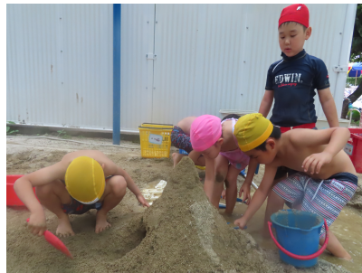
みんなで力を合わせて大きな山を作ろう