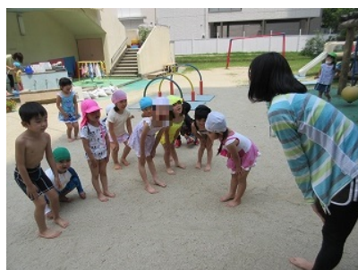
「いちにさんし しっかり動かしてね」