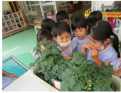
ミニトマト 葉っぱの後ろに実がなっているのを見つけました