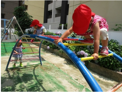
太鼓橋に挑戦 向きを変えながら慎重に渡っています