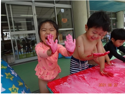
「見て見て～ イチゴの手になっちゃった～」