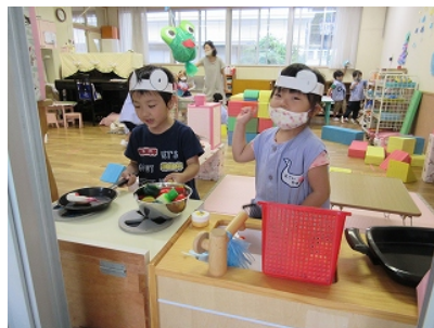
かえるだいすき カエル兄さんとカエル姉さんお料理中