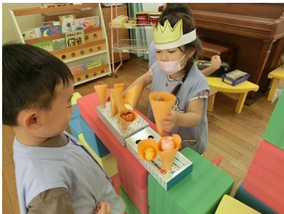
「アイスクリーム屋さんです」 「どれがいいですか？」

同じようなものを身に着けたり、同じ場所に集まったりして自分の思いを表しながら友達や先生と過ごす心地よさを感じています。