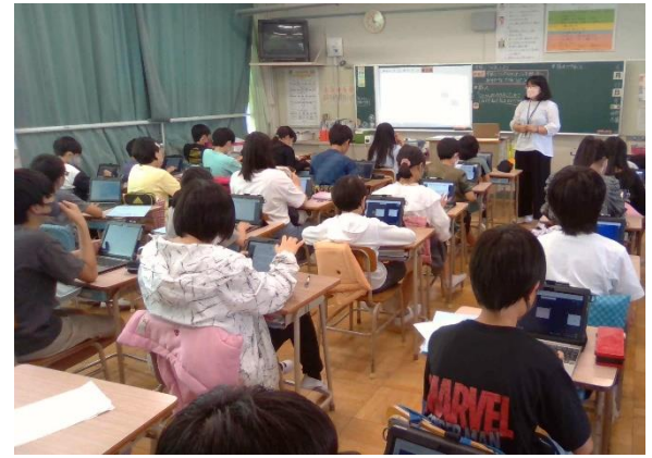
<学習のまとめ・振り返りに取り組む様子>