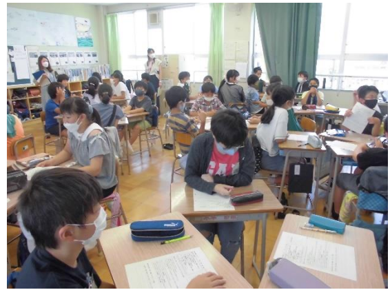
<グループで話し合い、学校のためにできることを考える様子>