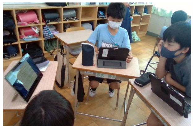
<グループで互いの情報を伝え合う様子>