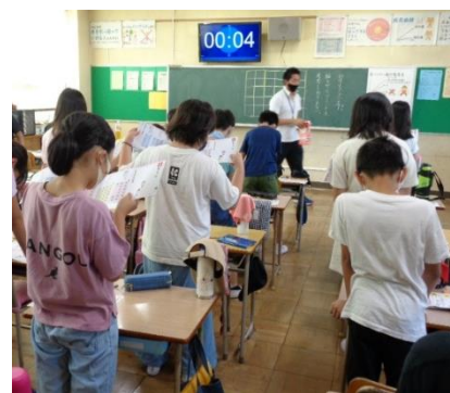
<4年生の朝の学習風景>

“同じ学習を繰り返し” 行い、累積することで、自分を振り返り、自身の成長を感じることができます。さらに、時間を計るという“負荷を掛ける”ことで、子どもたちは「前回よりも早く！」を意識し、より“集中した学習”になっていきます。単純な繰り返しではただの作業となることもあります。学習には“集中するための負荷”が重要だと改めて感じました。