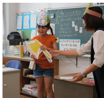
【役割演技をする様子】