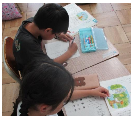
【ワークシートに考えを書く様子】