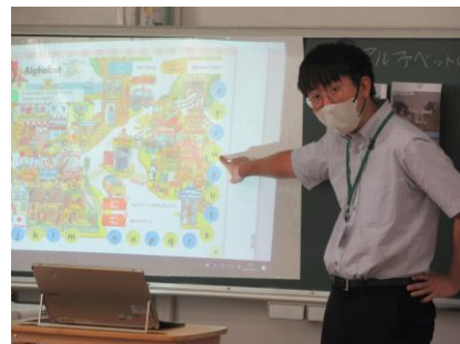
【小柳先生 4年外国語活動の授業】