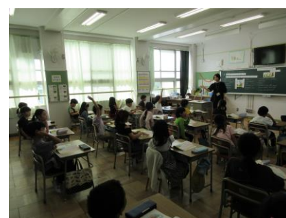
【道徳の授業の様子】

今回の授業参観で行った2年生の道徳の授業で紹介します。あひるやかめ、白鳥やりすの中から動物を選択(自己選択・自己決定)し、動物の気持ちになって、「自分と違うところがある友達と一緒に楽しく過ごすためにどんな気持ちが必要か」を友達と考えました。探究的な学習というのは、自分なりの問いを立て、自分なりの方法で、自分なりの答えにたどり着くことができる学びの事です。自己選択した動物の気持ちを自分なりに考え、途中、役割演技などもしながら、めあてである「自分と違うところがある友達と一緒に楽しく過ごすためにどんな気持ちが必要か」という課題にたどり着いたということです。