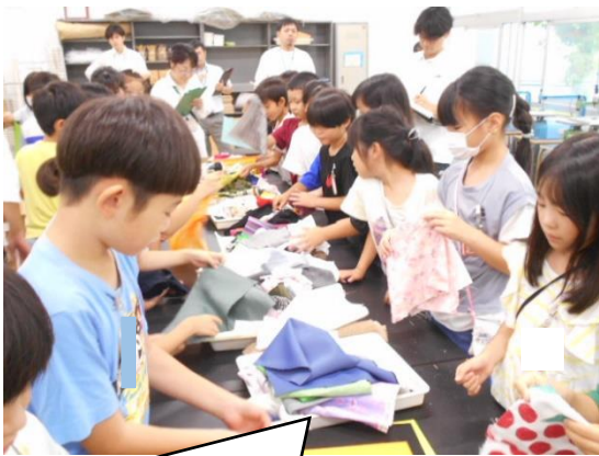
たくさんの布の中からお気に入りを選ぼう。