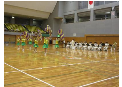
【消防音楽隊の皆様の演奏・演技】