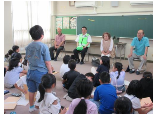
【感想を話している児童の様子】

そして、静かで犯罪が少なく、穏やかで良い人が多い、住みやすい地域と教えていただき、子どもたちは、枇杷島の「すてき」に触れ、自分の住む地域について、より深く考えることができました。