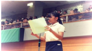
【代表児童による誓いの言葉】