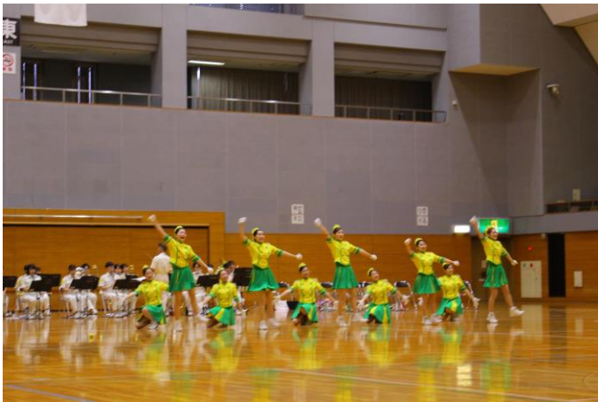
盛り上がったジャンボリミッキーの演奏とダンス