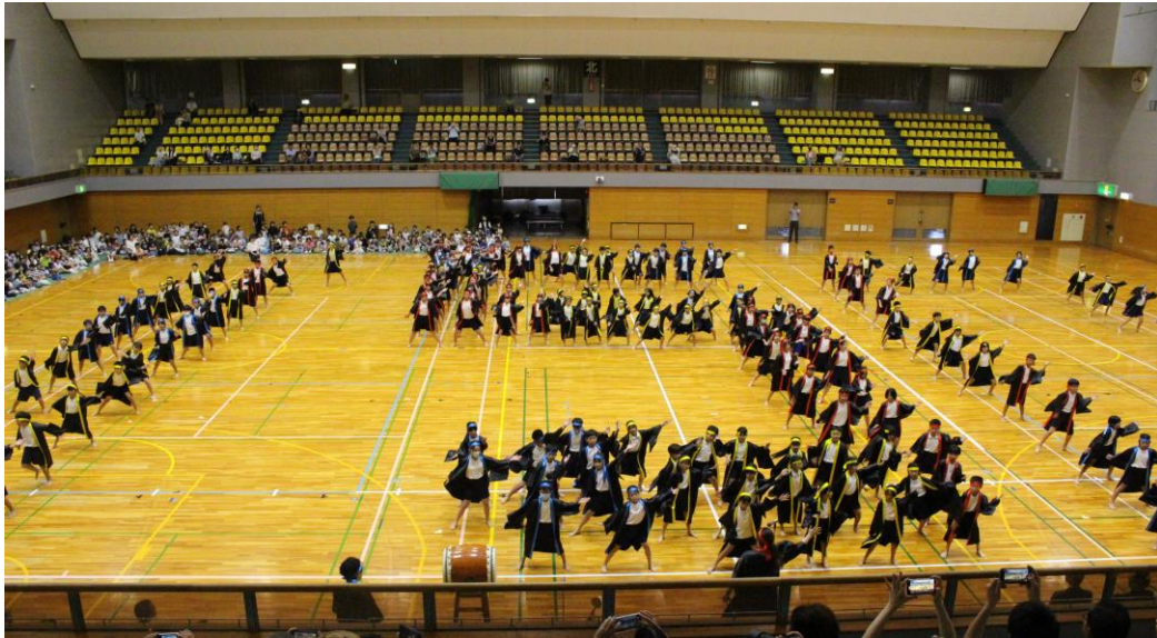
“150” がきまったソーラン節

9月18日の式典では、ソーラン節を披露したり、名古屋市消防音楽隊とリリーエンゼルの演奏を聞いたりして、心に残る記念行事となりました。