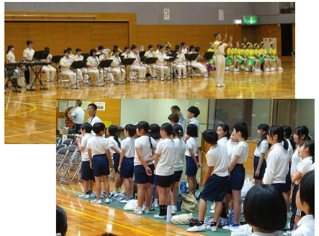
音楽隊の演奏で歌った枇杷島小学校校歌