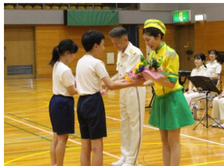
学校の代表として、感謝の花束を渡しました