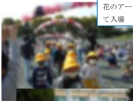
花のアーチをくぐって入場

4月8日1時間目に、運動場で「1年生を迎える会」を行いました。〇×クイズや進化ジャンケンなどで楽しく過ごしました。