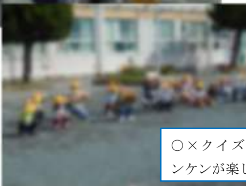
〇×クイズや進化ジャンケンが楽しかったよ。