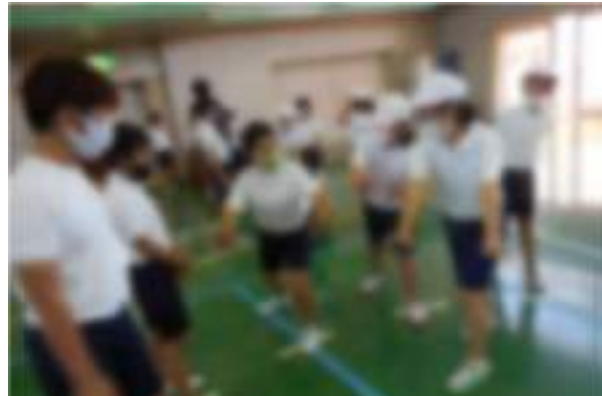
ペアの3年生に踊りのポイントを教えました。