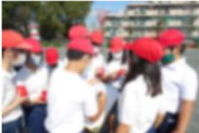
種目別練習会でコツを話し合っ練習しました。