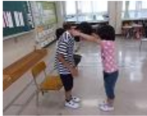
【プレゼントを渡している様子】