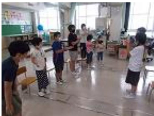
【みんなで歌を歌っている様子】

1学期の誕生日会では、音楽で学習した「さんぽ」を歌ったり、「ごろごろどかん」というゲームをしたりして楽しい時間を過ごしました。今年はプラ板に思い思いのイラストを描き、アクセサリにしてプレゼントしました。プレゼントをもらった子どもはうれしそうにしていました。