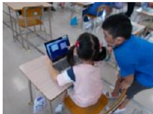
【友達と答えを確かめ合う様子】