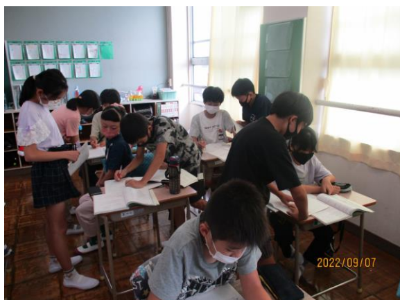
授業での教え合い