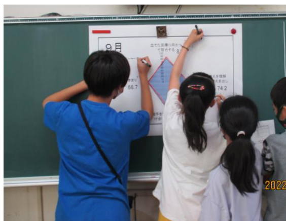
みんなで学級力を高めよう！