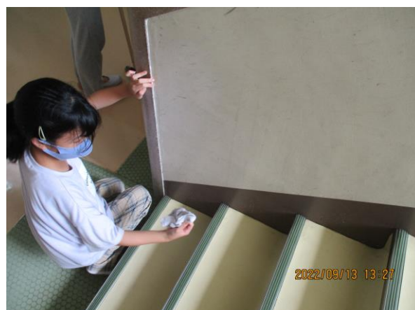
掃除は／ンおしゃべり！心を磨こう！