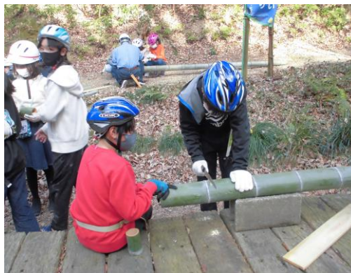
【オアシスの森体験の様子】