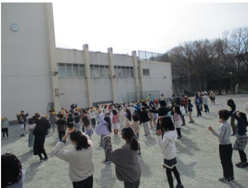
【ダンスウィークの様子】